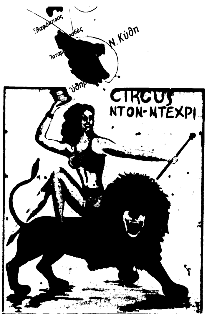
386. Καβάλα. Πανώ τσίρκου.

Πολύ περισσότερο όταν πρόκειται για επεξεργασίες διάχυσης της γνώσης, μέσα από την ολόπλευρη, υπεύθυνη και κριτική αντιμετώπισή της που τη μετατρέπει από συσσωρευτική διαδικασία αφηρημένων, εξειδικευμένων και μόνο από ειδικούς κατανοητών πληροφοριών, σε απλά, άμεσα προσεγγίσιμη μέθοδο κοιτάγματος των καθημερινών προβλημάτων που όλοι αντιμετωπίζουμε και τη λειτουργική σύνδεσή τους με τα γενικότερα οικολογικο-κοινωνικά, πολιτικά και ιδεολογικά προβλήματα, επεξεργασίες απομυθοποίησης δηλαδή της όποιος γνώσης μέσα από ανοιχτές και αδογματίστες συζητήσεις που η παραδοσιακή αυταρχικότητα διάκρισης διδασκόντων-διδασκόμενων δεν πρέπει να έχει κανένα νόημα: που η κοινωνική πείρα και εξειδικευμένη γνώση κάθε συνεργάτη-εισηγητή, κάθε πολίτη